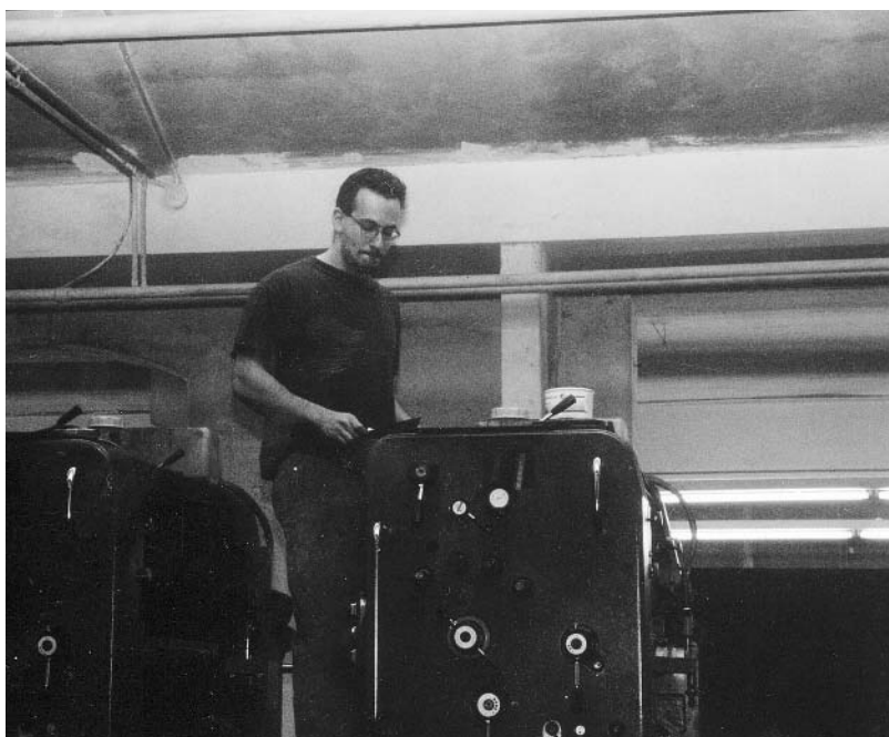
Genossenschaftsdruckereien verlieren immer häufiger auch Aufträge für linke Publikationen an Billiganbieter.

Interessant ist auch das Phänomen, dass zahlreiche linke Publikationen gar nicht mehr von Betrieben gleicher politischer Couleur gedruckt werden. Es scheint, dass heute vermehrt preisrelevante als politische Kriterien bei der Auswahl der Druckerei gelten. Zudem können viele der kleinen «Genossenschaftsdruckereien» punkto Technik mit den Grossen nicht mithalten. Gleichzeitig werden viele linke Inhalte von eher rechts gerichteten Druckereien nicht mehr zurück gewiesen. Genossenschaftsdruckereien haben ihren ursprünglichen Zweck, der Zensur zu entgehen, also weitgehend verloren. Dagegen hat Hanspeter Vieli festgestellt: «Politisch eher rechts gerichtete Unternehmen und Organisationen bleiben viel häufiger bei den Druckereien ihrer eigenen Gesinnung».