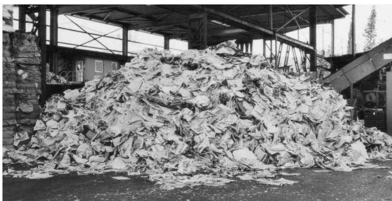
Urwaldfreundliche Gemeinden verpflichten sich dazu, die Papierflut in der Verwaltung einzudämmen.

So wurden letztes Jahr alle Gemeinden in einem Brief auf die Möglichkeit hingewiesen, sich als «urwaldfreundliche» Gemeinde registrieren zu lassen. Im Vordergrund stehen der Verzicht auf Holzprodukte aus Raubbau und die Verwendung von Holz mit FSC-Zertifizierung. Darüber hinaus benutzen urwaldfreundliche Gemeinden wenn immer möglich Recycling-Papier und streben eine Senkung ihres Papierverbrauchs an. In St.Gallen beispielsweise, wo schon seit 1996 auf exotische Raubhölzer verzichtet wird, ist der Gebrauch von Recyclingpapier in der Verwaltung seit dem Stadtratsbeschluss vom Januar 2003 verbindlich. Die Verordnung schreibt einen Recyclinganteil von 70 Prozent beim Papierverbrauch vor. «Die Umstellung auf Recyclingpapier war nötig, wichtiger aber ist eine generelle Reduktion des Papierverbrauchs», stellt Thomas Wepf, stellvertretender Leiter der Umweltfachstelle St.Gallen angesichts eines jährlichen Verbrauchs von acht Millionen A4-Blättern fest. Mit der Verwendung von Makulaturpapier, dem Ausbau der elektronischen Medien und doppelseitigem Kopieren und Drucken will er nun die Papierflut in der